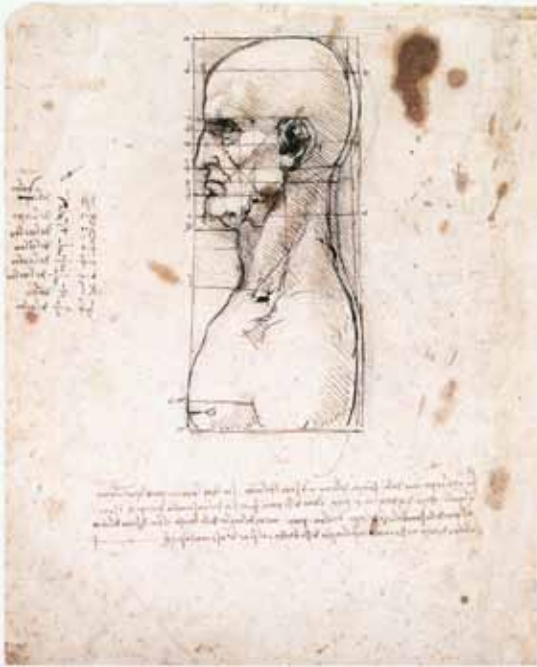
Léonard de Vinci Tête masculine dans le profil avec des proportions 1490 Stylo et encre sur le papier, 280 x 222 millimètres Dell'Accademia de Gallerie, Venise